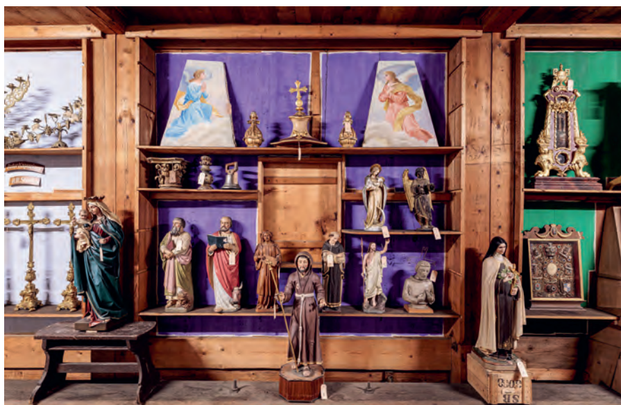
Das Schaulager beherbergt alle, wirklich alle Dinge, die im Sommer 2019 im Dachstock und in Nebengebäuden der Kirche auffindbar waren. (Abb. 1)

schmacks der Kirchgemeinde. Die schiere Menge an Gleichem oder Ähnlichem bezeugt die lebendige Dynamik im Umgang mit der Ausstattung von Kirchen und Kapellen.