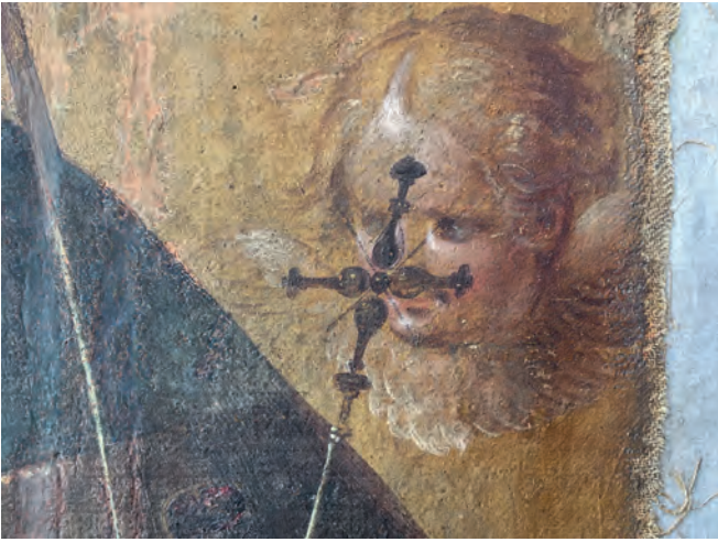
In dieser Detailaufnahme sind Graphitlinien in der letzten Schicht zu erkennen. (Abb. 14)

Effizienz und Effektivität. Denn Meuss hatte nicht mit dieser Nahsicht auf sein Gemälde gerechnet. Das Bild ist für die Betrachtung aus Distanz und den Blick von unten konzipiert. Deshalb konnte er auch Vages stehen lassen. Sein ganzer Übermut, die unterschiedlichen Tempi des Farbauftrags in seiner freien, suchenden Malweise werden nicht mehr ablesbar sein, wenn die Krönung Mariae auf über sechs Metern Höhe zurück im Hochaltar eingefügt ist. Umso mehr schätze ich mein Glück, dass dieses Bild über lange Zeit Teil meines Arbeitsalltags war und ich einem längst verstorbenen Kollegen nähergekommen bin.